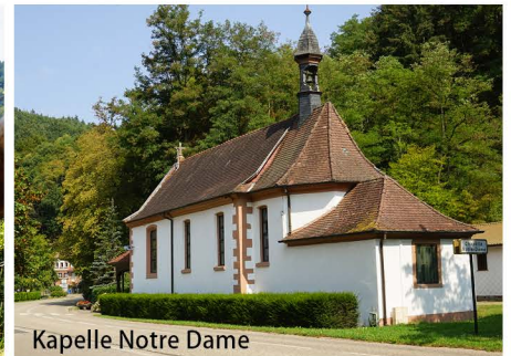
Kapelle Notre Dame