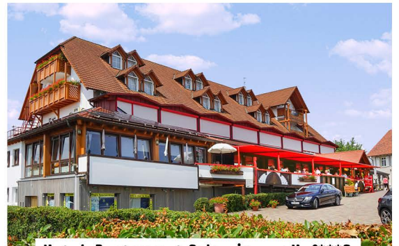
Hotel-Restaurant Schweigener Hof****S

D-76889 Schweigen-Rechtenbach Hauptstraße 2 Tel. 0049 (0) 6342 9250 www.schweigener-hof.com